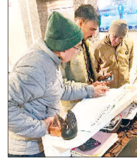
नारनौल। होटल के रजिस्ट्रार की जांच करते पुलिसकर्मी तथा चेकिंग अभियान चलाती डॉग स्कॉड टीम।