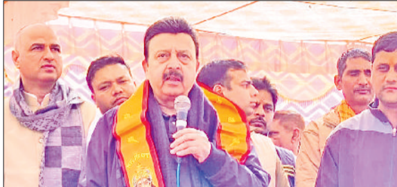
रेवाड़ी। कार्यक्रम में लोगों को संबोधित करते उद्योग मंत्री राव नरबीर सिंह।