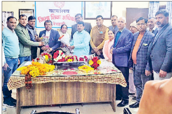
रेवाड़ी। पदोन्नत शिक्षा अधिकारियों का स्वागत करते हसला के पदाधिकारी।