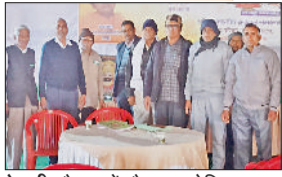
रेवाड़ी। बैठक में मौजूद एसोसिएशन के सदस्य।

बिजली पेंशनर्स एसोसिएशन 23 को मनाएगी बसंत उत्सव