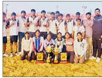
रेवाड़ी। खिलाड़ियों को सम्मानित करते आयोजक।