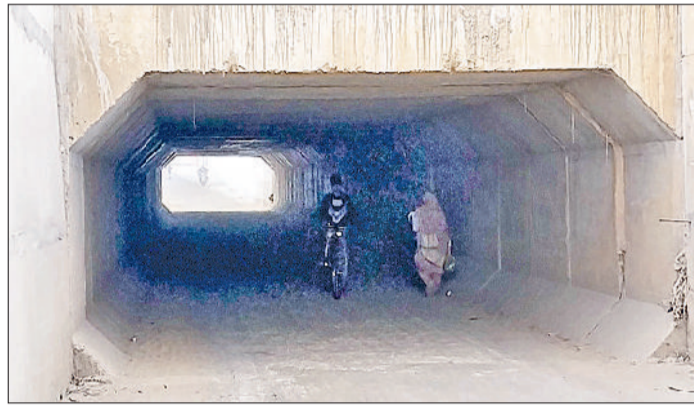
रेवाड़ी। अंडरपास में दिन के समय छाया अंधेरा।

भाड़ावास रोड पर आरओबी व अंडरपास में अभी तक नहीं लगी स्ट्रीट लाइटें, अंधेरे से बढ़ रही लोगों की परेशानी