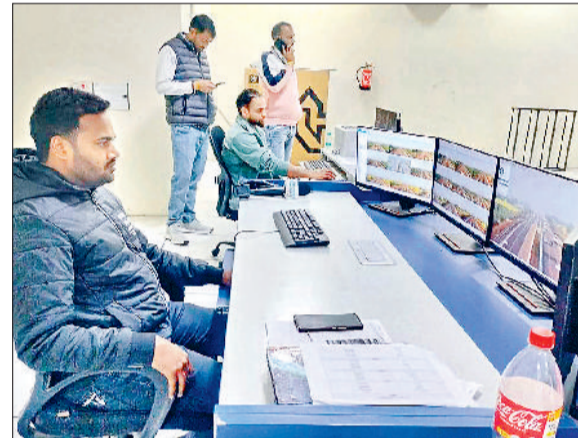
कनीना। नेशनल हाइवे 152 डी से गुजरते वाहनों की गतिविधियों को कंट्रोल करने के लिए एनएचआई, टोल एजेंसी व जिला प्रशासन के अधिकारी लगातार प्रयासरत हैं।