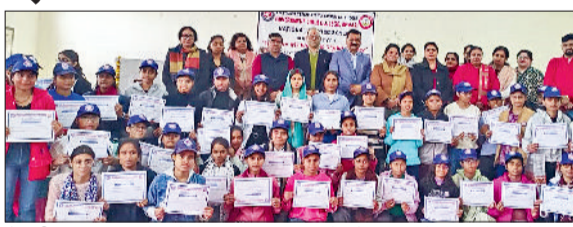
रेवाड़ी। एनएसएस कैंप के समापन पर छात्राओं को सर्टिफिकेट प्रदान करते हुए।