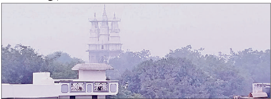
रेवाड़ी। शुक्रवार शाम को शहर में छाया हल्का कोहरा।

वाली ठंड से कुछ हद तक राहत प्रदान करने का काम किया है। हालांकि कुछ इलाकों में फसलों पर पाला जमा है। इस सप्ताह के अंत में मौसम में बदलाव की संभावना जताई जा रही है। शुक्रवार को सुबह हल्के कोहरे के बाद सूरज की चमक ने कड़ाके की ठंड का असर कम कर दिया। अधिकतम तापमान 4.0 डिग्री बढ़कर 25.5 डिग्री सेल्सियस पर पहुंच गया, जिससे दिन के समय ठंड का असर काफी कम रहा। न्यूनतम तापमान भी माइनस से प्लस में आ गया। यह 1.5 डिग्री की वृद्धि के साथ 2.0 डिग्री सेल्सियस दर्ज किया गया। गत वर्ष की तुलना में रात का तापमान सामान्य से काफी कम और दिन का तापमान ज्यादा बना हुआ है। गत वर्ष 16 जनवरी को अधिकतम तापमान