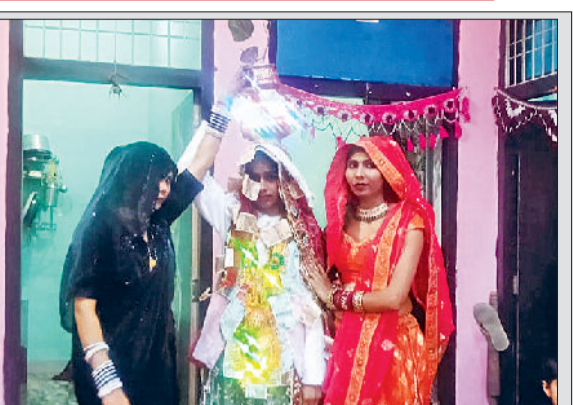
रेवाड़ी। कन्या के जन्म पर कुआं पूजने जाती महिलाएं।

बीते साल जनवरी माह में बारिश होने से किसानों को काफी राहत मिली थी। इस बार अच्छी बूंदबांधी तक नहीं हुई है, जिससे सूखी ठंड फसलों के लिए नुकसानदायक साबित होने लगी है। दो दिन तक तूफान जिले में पाला जमने के बाद तीसरे दिन कुछ इलाकों में हलका पाला देखने को मिला। पाला जमने के कारण सरसों की अनेकों फसल को नुकसान होने का अंदेश है। नुकसान का पता लगाना एक सप्ताह बाद लगाना शुरू होगा। इस समय किसान बारिश का बेसब्री से इंतजार कर रहे हैं। अगर अच्छी बारिश होती है, तो इससे फसलों को अच्छा फायदा मिलेगा।