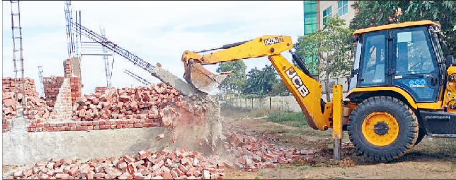
रेवाड़ी। नारनौल रोड पर अवैध कॉलोनी का निर्माण तोड़ती जेसीबी।

डीटीपी विभाग की टीम ने शुक्रवार को रेवाड़ी-नारनौल रोड स्थित गांव गांगोली की राजस्व सीमा में अवैध निर्माणों को ध्वस्त किया। डीटीपी की कार्रवाई से प्लॉटिंग करने वाले लोगों में खलबली मची हुई है। पुलिसबल की मौजूदगी में डीटीपी की कार्रवाई का कहीं विरोध नहीं हुआ। डीटीपी की लगातार कार्रवाई के बाद भी कॉलोनाइजर व डीलर नई कॉलोनियां विकसित करने में लगे हुए हैं। डीटीपी के निर्देश पर शुक्रवार को पुलिसबल व ड्यूटी